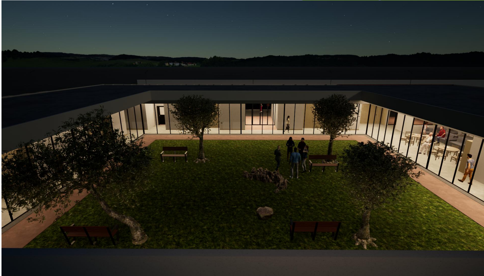
Pátio central vista da varanda do 1.º andar