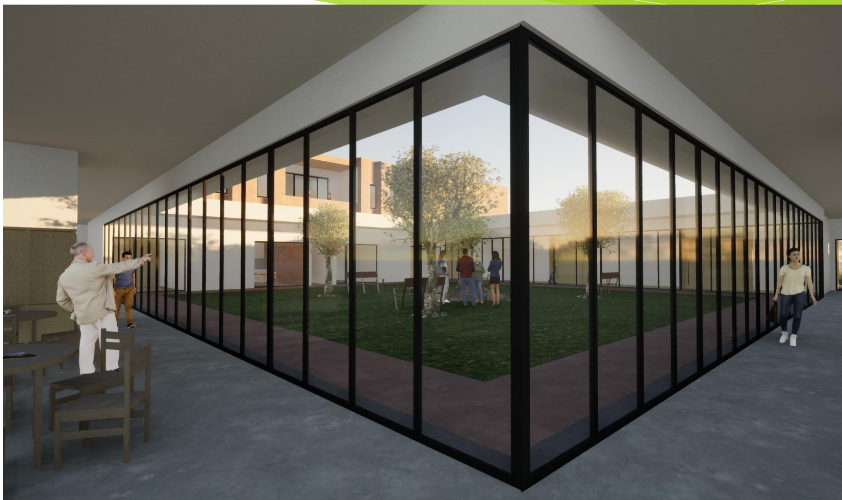
Vista da sala de convívio e atividades sobre o pátio central