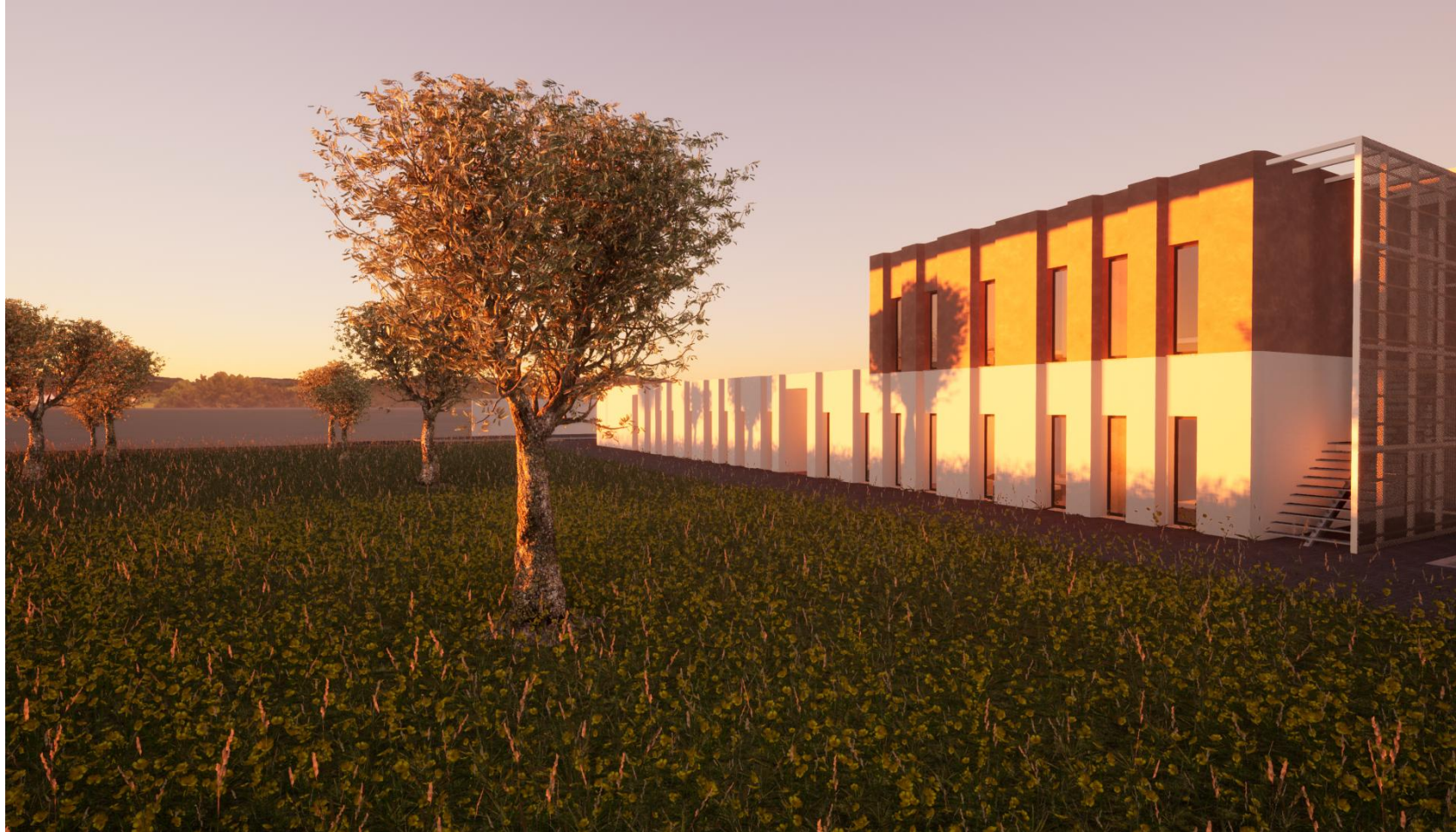
Alçados sul e poente do edifício