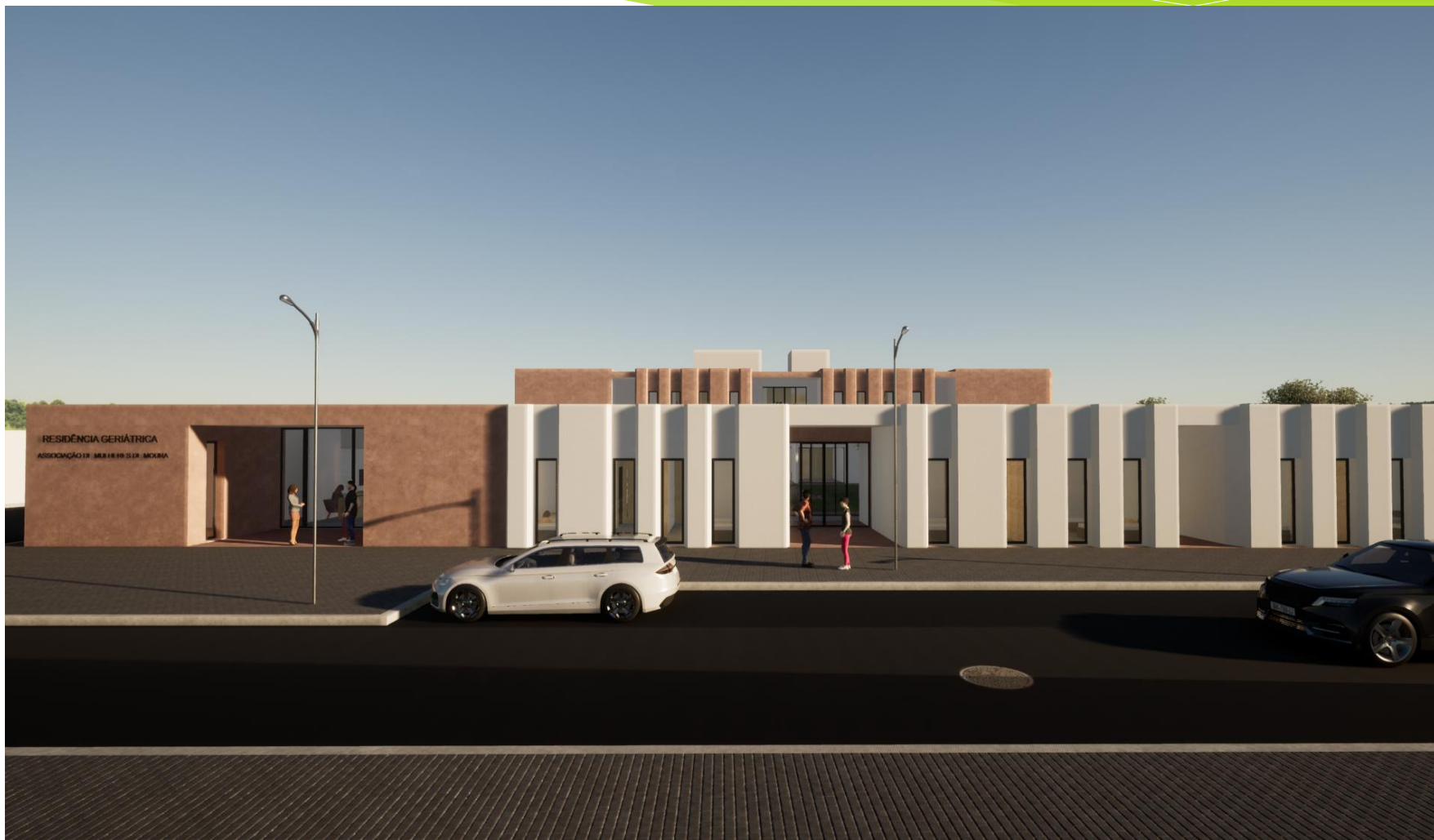
Alçado norte do edifício