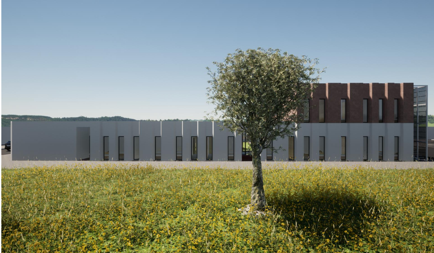
Alçado Poente do edifício