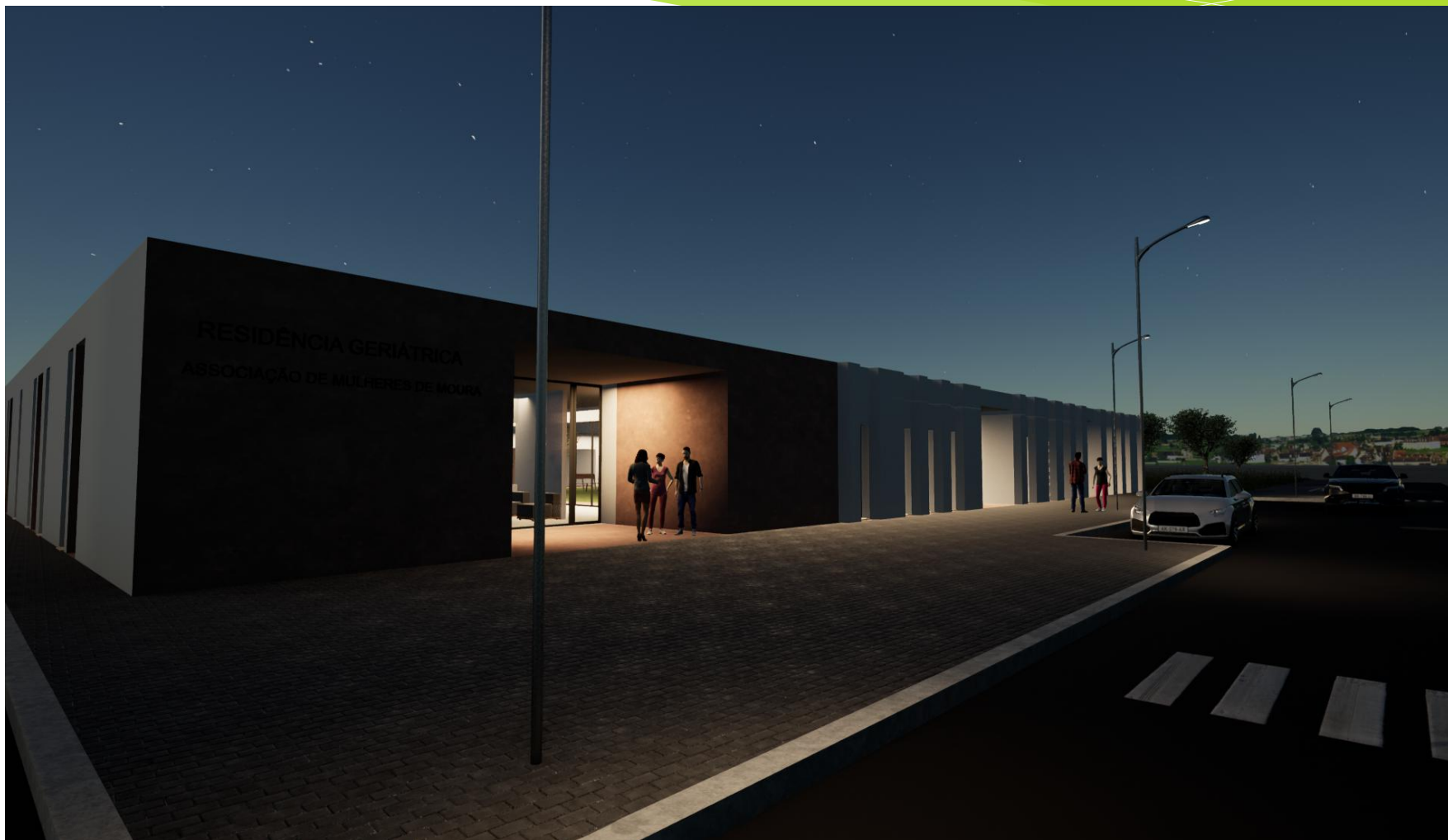
Alçado norte do edifício