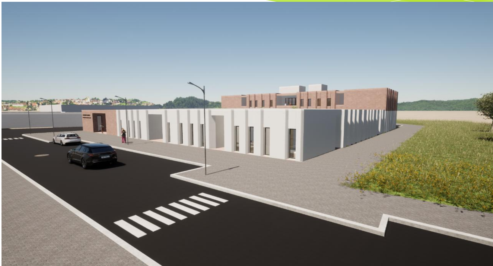
Alçados norte e poente do edifício proposto – Vista rua dos Açores